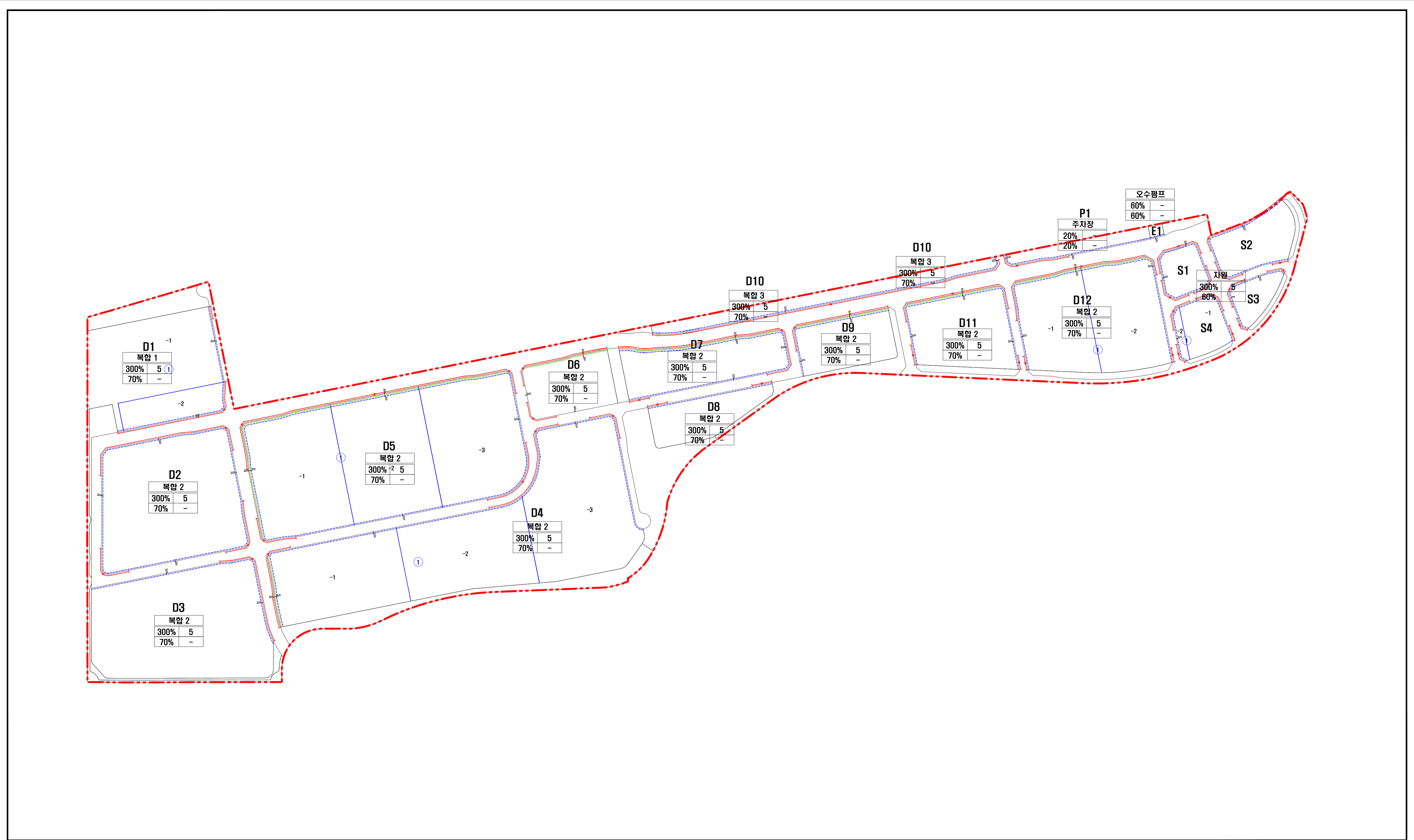
도 면 범 례